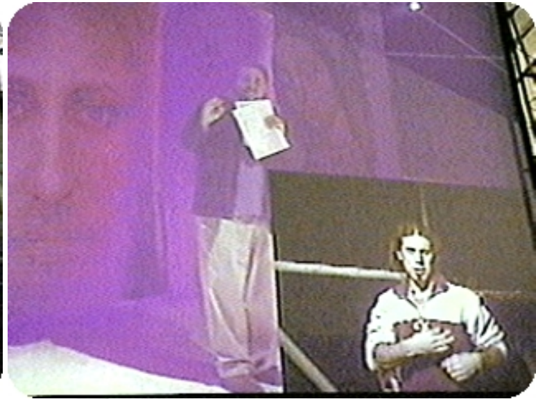
Abnegados colaboradores e interpretes en pantalla gigante