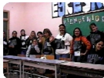
Gente voluntaria y generosa

El sábado a las 20hs comenzó la vigilia, llegamos al lugar que nos asignaron, nos anunciaron por micrófono y todos gritaban y aplaudían, no solo a nosotros nos anunciaron también a todos los otros grupos que vinieron de las otras provincias. Comenzaron con los fuegos artificiales que pudimos apreciar muy bien, fue un espectáculo muy lindo.