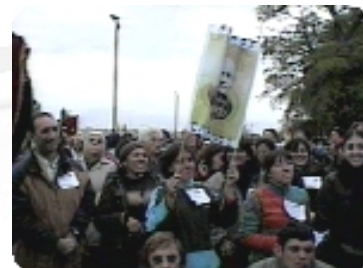
el corazon de don orione fue vivado por todos