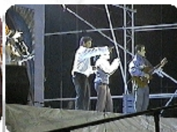
Bailes y canciones